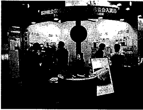
① ツーリズム EXPO ジャパン 2016 (日本旅行業協会・日本観光振興協会主催) 会期: H28. 9. 23~25 の3日間 場所: 東京ビックサイト 出品数: 第56回入賞品72品を展示PR