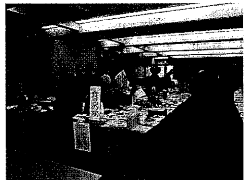
<昨年度の審査風景>