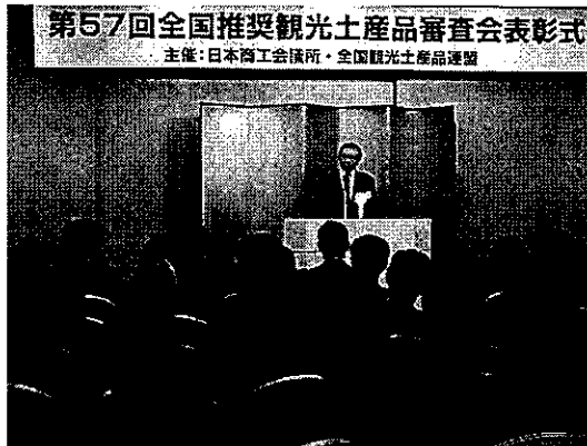
場所: 羽田空港第一旅客ターミナルビル 「ギャラクシーホール」 会期: 平成29年2月9日(金)